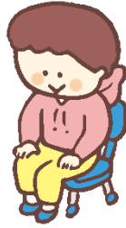
sit down すわ 座る