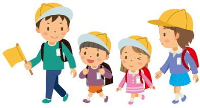
go to school どうこう 登校する