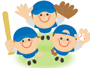
baseball やきゅう 野球