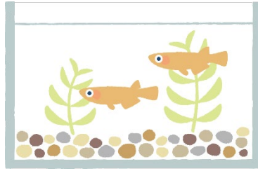
fish tank 水そう