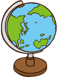
globe ちきゅう 地球ぎ