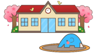
kindergarten ようちえん 幼稚園