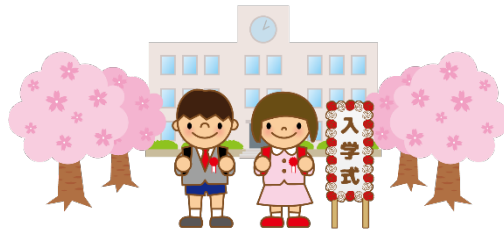
elementary school しょうがっこう 小学校