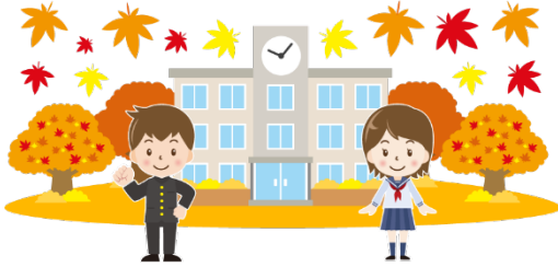
junior high school ちゅうがっこう 中学校